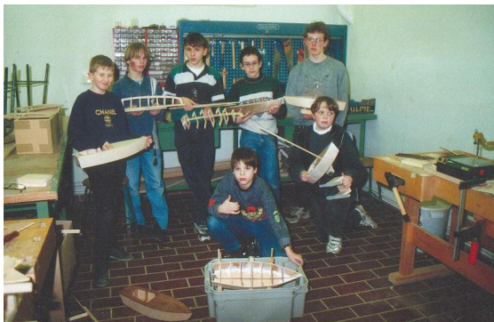
gemeinsames Basteln im Jugendzentrum

Die Mitglieder treffen sich zur geselligen Runde freitags um 19 Uhr im ‚Kapitäns salon‘. Donnerstags findet ein Treffen von 19 bis 21 Uhr im Jugendzentrum „Alte Emstorschule“ zum Basteln statt.