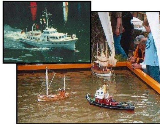
Yacht / Schaufahren auf kleinem Bassin

Ein Hobby für kleine und große Ansprüche und auch dem entsprechenden Geldbeutel. Die Palette reicht von kleinen Yachten für Anfänger bis hin zu detaillierten Kriegs- und Arbeitsschiffen. Je nach Aufwand und Können.