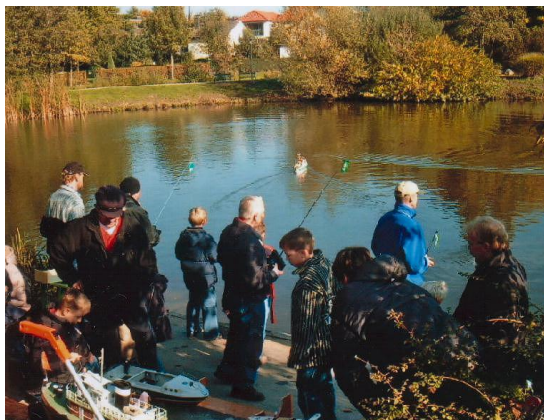
Schaufahrten sonntags am Emssee

Der Anlegesteg am Emssee in Rheda-Wiedenbrück wurde schon 1995 von den Mitgliedern gebaut. Je nach Wetterlage findet sonntags meist in der Zeit von 11 bis 13 Uhr das Schaufahren der Modelle statt. An warmen Samstagabenden werden gelegentlich auch Schiffmodelle mit Beleuchtung zu sehen sein.