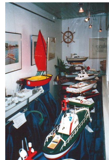
Ein Teil der Ausstellung am ‚Reethus‘