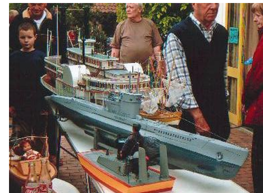
Ausstellung vor dem Clubhaus

Der Bau des Ausstellungs- und ‚Kapitäns salon‘ am ‚Reethus‘ wurde am 10.02.1996 mit Unterstützung der Flora-Westfalica begonnen. Am 20.04.1996 war die feierliche Eröffnung. Die Ausstellung ist von Anfang April bis Anfang Oktober bei gutem Wetter tagsüber geöffnet.