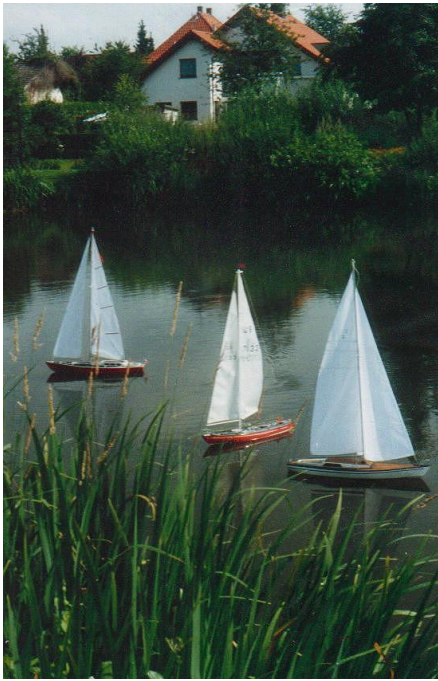
gemütliche Idylle am Emssee

Die Mitglieder treffen sich zur geselligen Runde freitags um 19 Uhr im ‚Kapitäns salon‘. Donnerstags findet ein Treffen von 19 bis 21 Uhr im Jugendzentrum „Alte Emstorschule“ zum Basteln statt.